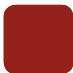
Vinröd RAL 3009