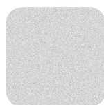
Silver RAL 9006