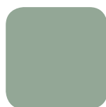
Ärggrön RAL 6021