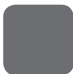
Blyerts RAL 7024