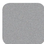
Aluzink AZ 185