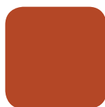
Tegelröd RAL 8004