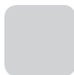
Galvaniserad Z 275